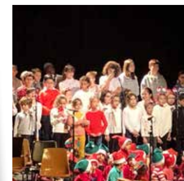
Noël des Petits Artistes de l'Ecole des Arts 15/12/19