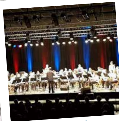
Concert Sainte Cécile des Pompons Bleus 19/11/19