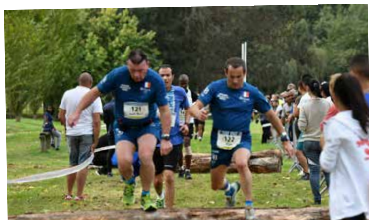
34 èmes championnats de cross des Polices 12/10/19