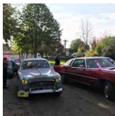
Sortie CCAS avec les Passionnés du Lion 2/11/19