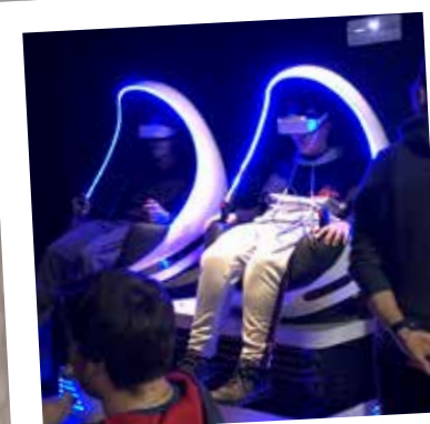
Tonneins In Game et son Cosplay 22, 23 et 24/11/19