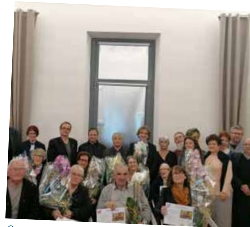
Concours des Villes Fleuries 29/11/19