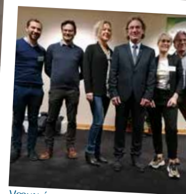
Vœux éco 17/01/20