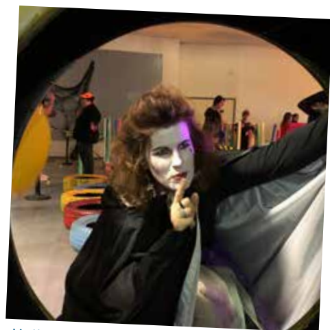
Halloween Party 31/10/19