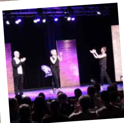
Toulouse j'adore 19/10/19