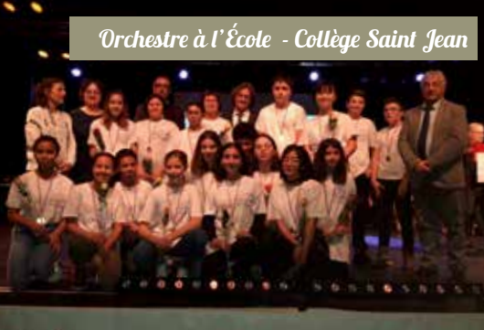
Orchestre à l'École - Collège Saint Jean