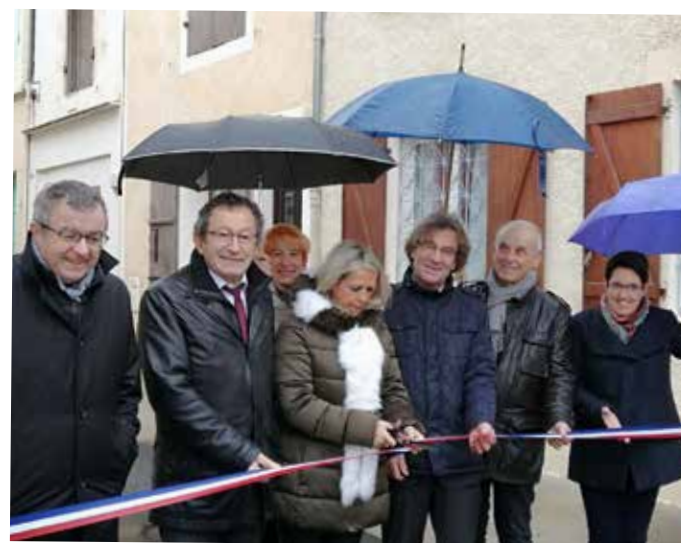
Inauguration Cours de la Marne 26/11/19