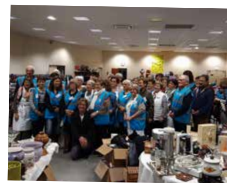
Braderie Inner Wheel 22 et 23/11/19