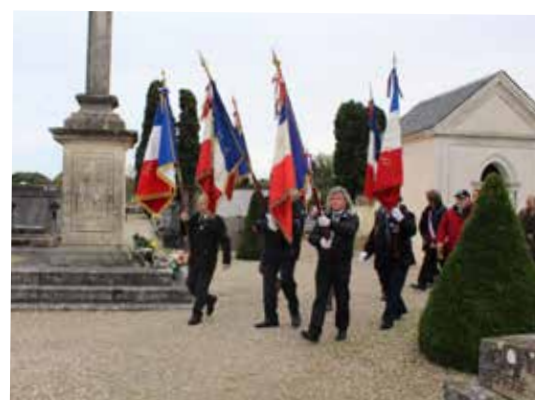
Commémoration du 11 Novembre 11/11/19