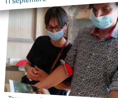
Tournage Rosa Bonheur 3 Octobre