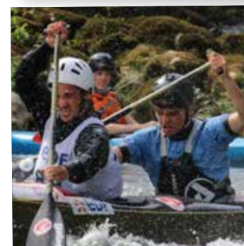
Course Kayak 20 septembre