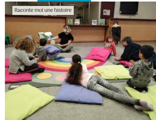
Raconte moi une histoire