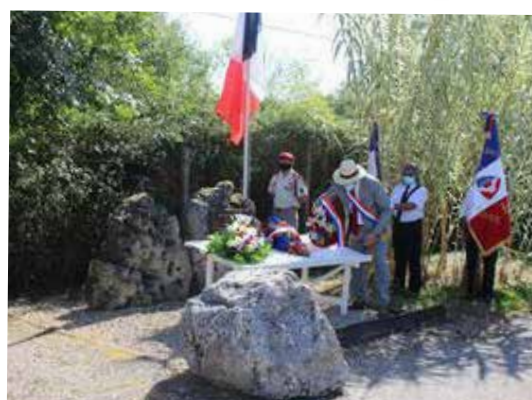
Commémoration Libération Tonneins 20 août