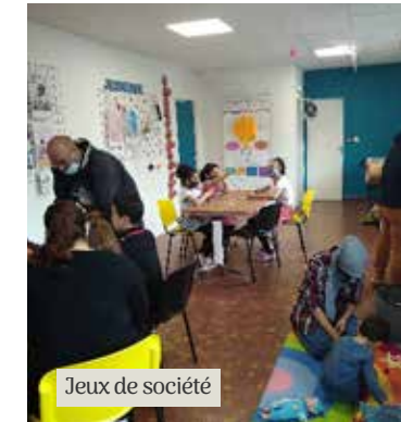
Jeux de société