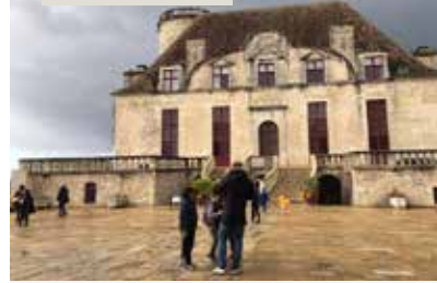
Château de Duras