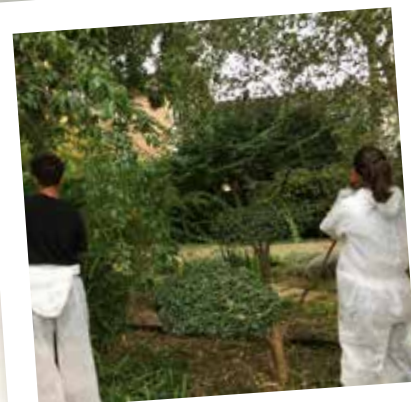
Jobs vacances Juillet