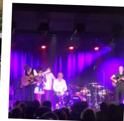
Concert Voice of freedom 1 er Octobre