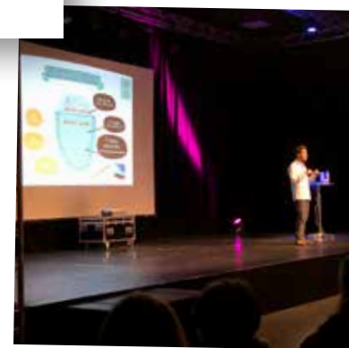
Conférence Famille zéro déchet 27 Octobre