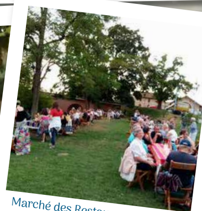
Marché des Restaurateurs 15 Août