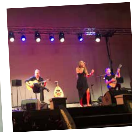
Concert Semillas 17 Septembre