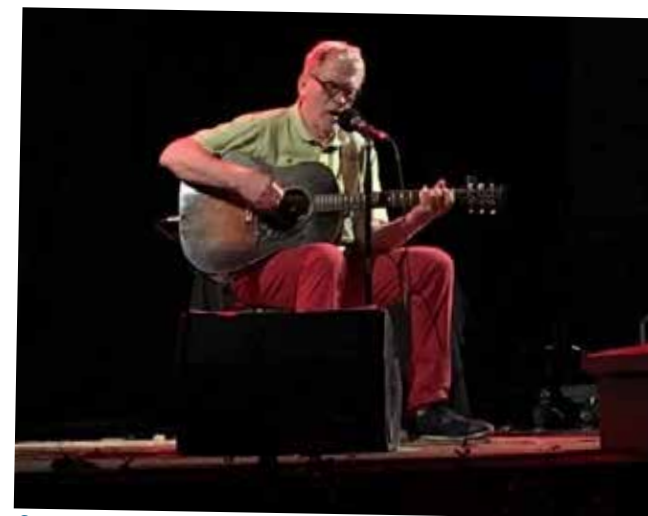
Concert Staccato - Dick Annegarn 11 Septembre