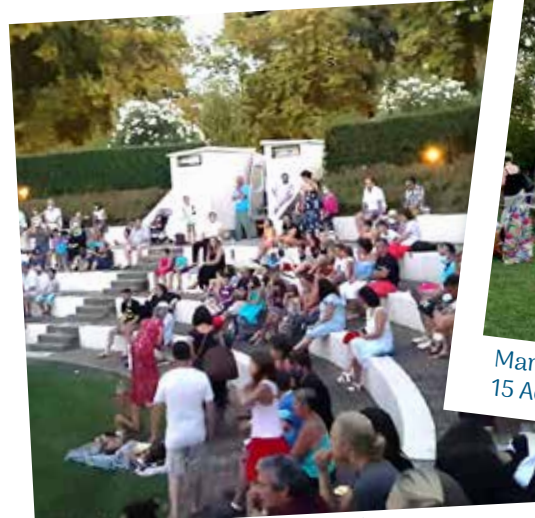
Ciné plein Air Tonneins Animations 20 Août