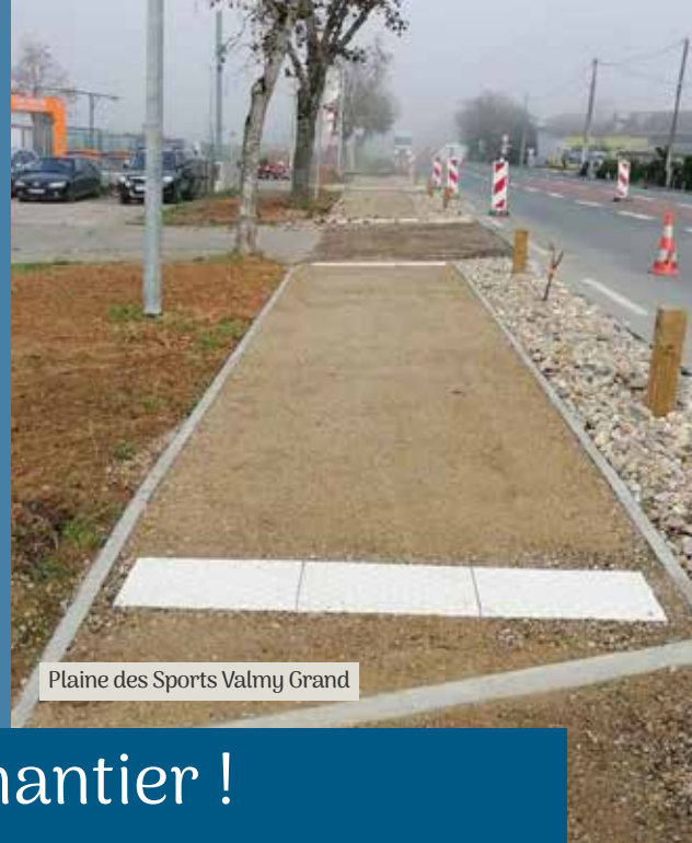
Plaine des Sports Valmy Grand