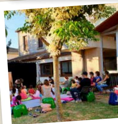
Histoire sans fin 11 septembre