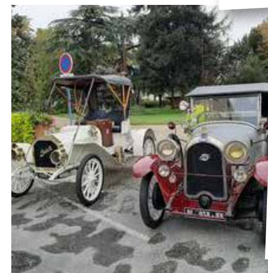
Expo Calandres Tonneinquoises 27 septembre