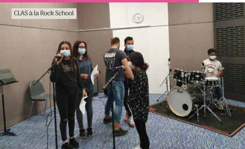
CLAS à la Rock School

Les chantiers, en partenariat avec les Services Techniques Municipaux et les Compagnons Bâisseurs ont permis l'embellissement du Jardin du Centre Culturel-Point Commun et d'une partie du Jardin Public.