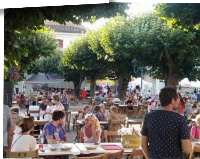
Marché des Producteurs de Pays Juillet